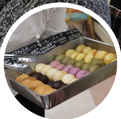
様々な味のパンをご用意↑

手作りパンをお届け・・・！麦久保園お手製のパンを出来たてで召し上がれ！お味は写真左から「ミニ食パン」「ココアチョコ」「プレーン」「紫いも」「よもぎ」「かぼちゃ」となっております。お先にパンを盛り合わせたお膳をお出しし、その後厨房スタッフがご利用者を回り追加のパンをお配りしながら感想を聞いて回りました。たくさんの方にパンの追加をしていただきました。これからも「楽しい食のイベント」にご期待下さい！