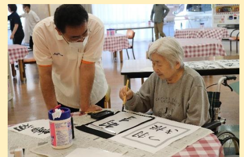
職員に見守られながら書き初めに取り組むご利用者。