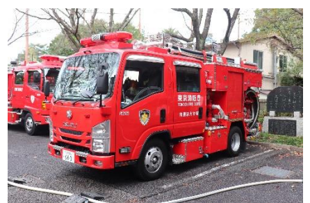
→秋川消防署の皆様が消防車に乗ってご来園されました！

地域合同防災訓練を実施いたしました。数十名の地域住民の皆様が麦久保園へご来園され、消防隊・消防団員ご指導の下、消火訓練、煙体験、応急救護訓練等を行いました。