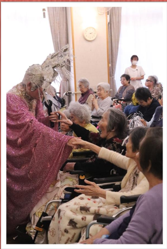
ご利用者と熱い握手を交わすまりもちゃん様←